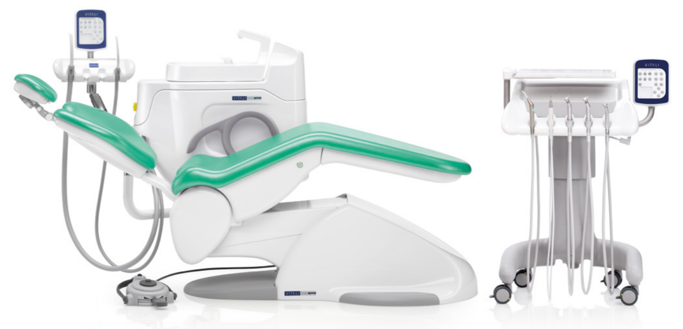
T5 EVO PLUS 4.0 CART